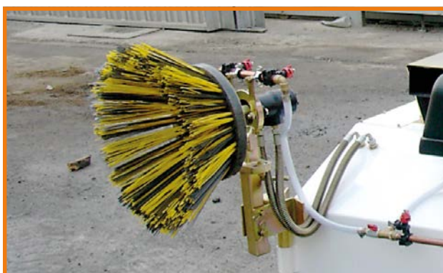
Spazzola laterale dx/sx Ø 600 mm in polipropilene misto acciaio (1)