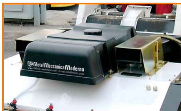
Kit innaffiante a pressione (2)